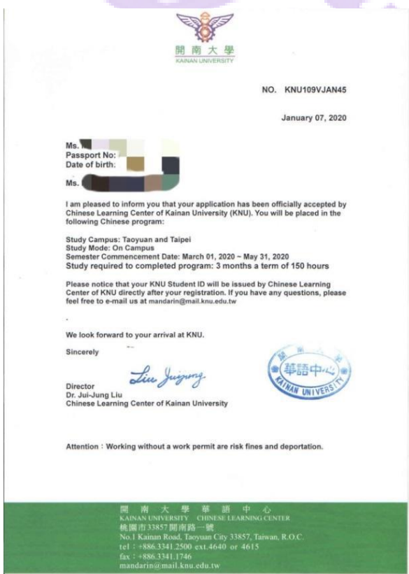
C. 開南華語中心入學信